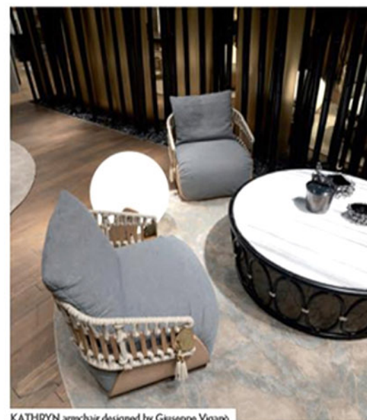
KATHRYN armchair designed by Giuseppe Viganò

When it comes to the style and meaning of luxury, Visionnaire is looking to go beyond the material value of things. We've thought long and hard about the meaning of the term luxury. It encapsulates some very precious values for our company and for the entire industry in Italy – attention to detail, sartorial expertise, unique products. The intangible value of those products goes beyond purely aesthetic beauty (in terms of both style and material) to tap into everything that goes into how a product is made. That's why Respiro really is the next step in the "greenery"