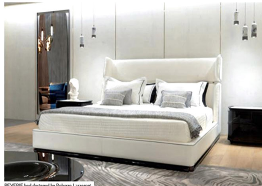
REVERIE bed designed by Roberto Lazzeroni