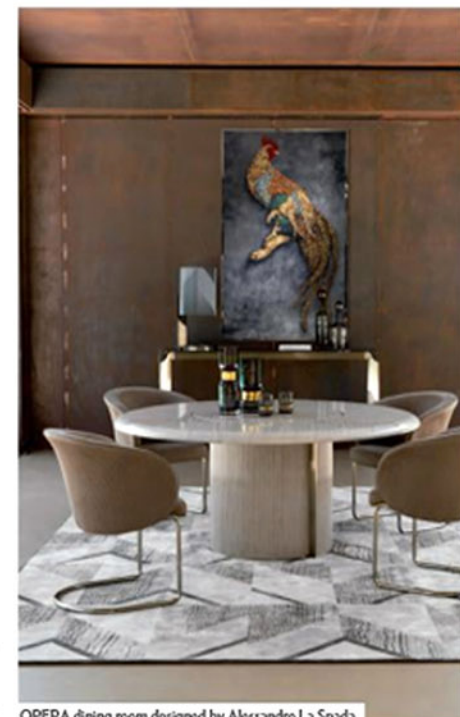
OPERA dining room designed by Alessandro La Spada