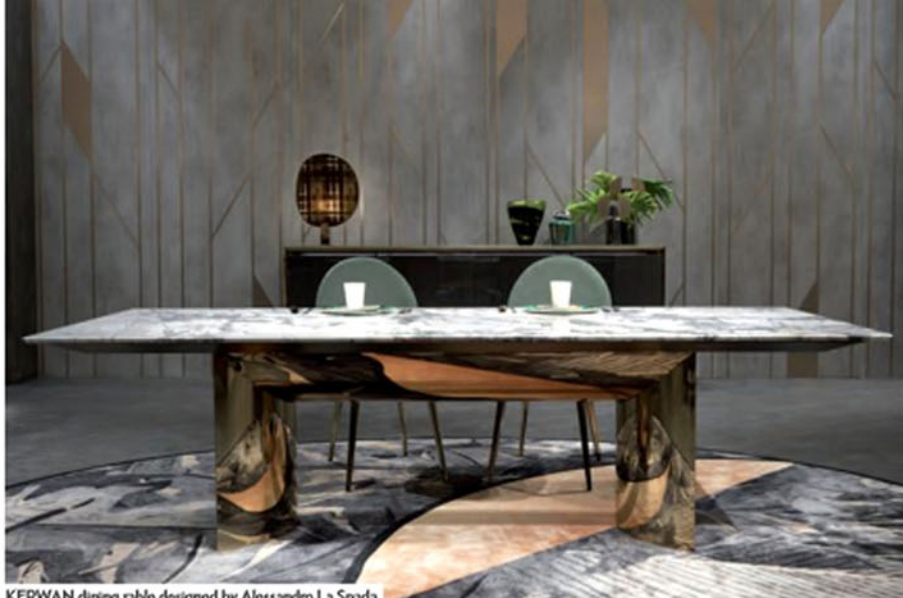
KERWAN dining table designed by Alessandro La Spada

Visionnaire ha la volontà di indirizzarsi verso un linguaggio e un significato di lusso che vada oltre il valore materiale delle cose. Ci siamo interrogati molto sul valore di questo termine; lusso riassume valori preziosi per l'azienda e per tutto il nostro sistema Italia: cura del dettaglio, capacità sartoriale, unicità del prodotto. Il valore intangibile che ne deriva, è sicuramente quello della bellezza, non solo estetica (del segno e del materiale) ma che scaturisce da tutto ciò che sta dietro alla realizzazione del prodotto stesso. Ecco che Respiro è davvero l'evoluzione del concetto 'greenery' presentato lo scorso anno, che chiude la riflessione sul significato di lusso oggi.