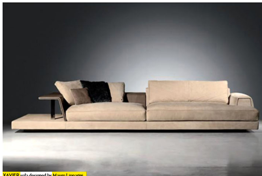
XAVIER sofa designed by Mauro Lipparini

Su questa impronta abbiamo realizzato un bellissimo progetto a Los Angeles, una villa dall'architettura razionalista che si affaccia sulla città, per la quale abbiamo realizzato tutto, fino al più piccolo dettaglio.